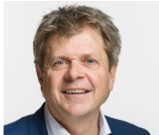
Jürg Grossen, Nationalrat glp BE